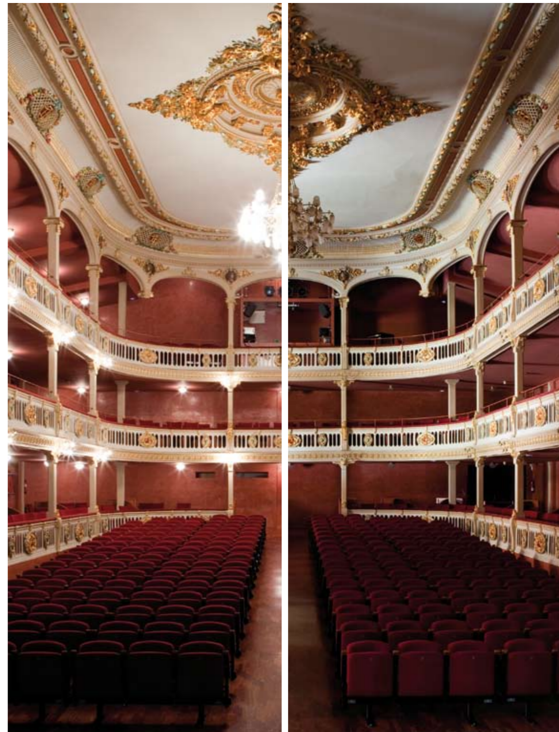
Parells i Senars , 2010 Lambda Print sobre alumini dibond 2 peces (45 x 120 cm) / u

Des dels seus inicis la banda ha aconseguit èxits en diferents concursos musicals i actualment estan promocionant el seu últim treball.