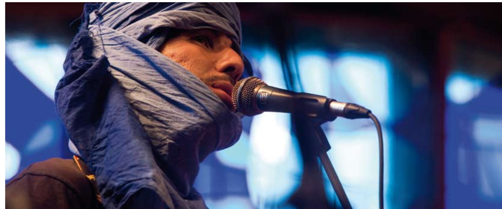
Auditori Pau Casals I , 2010 Lambda Print 72 x 30 cm

La composició "Cor i Corda", ens ofereix el seu sentiment d'admiració i respecte vers la figura del compositor Pau Casals; Una oda al gest universal d'aquest gran músic.