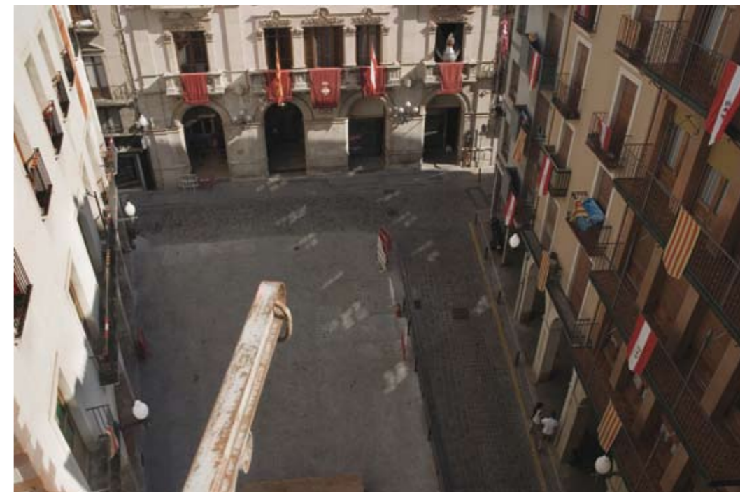
Plaça del Blat. Festa Major, 2010 Còpia giclée sobre paper Hahnemülhe 40 x 60 cm