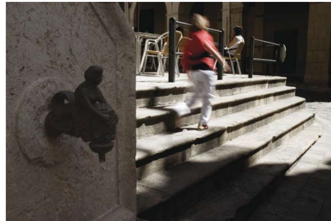
Plaça del Blat. Castells, 2010 Còpia giclée sobre paper Hahnemülhe 40 x 60 cm

President de l’aMt (2001-2004), és actualment vocal de la Junta, responsable i administrador de la web musicstgn.cat .