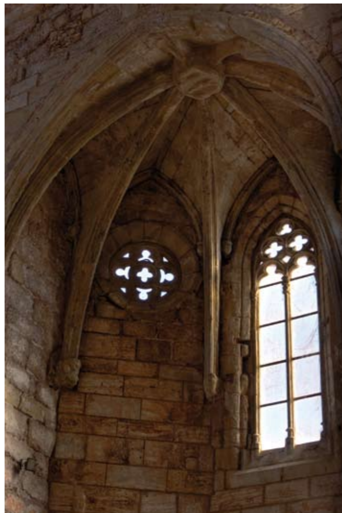
Donant pas a la llum, 2010 Lambda Print sobre fusta 50 x 70 cm

+ info: http://www.myspace.com/satorimacc