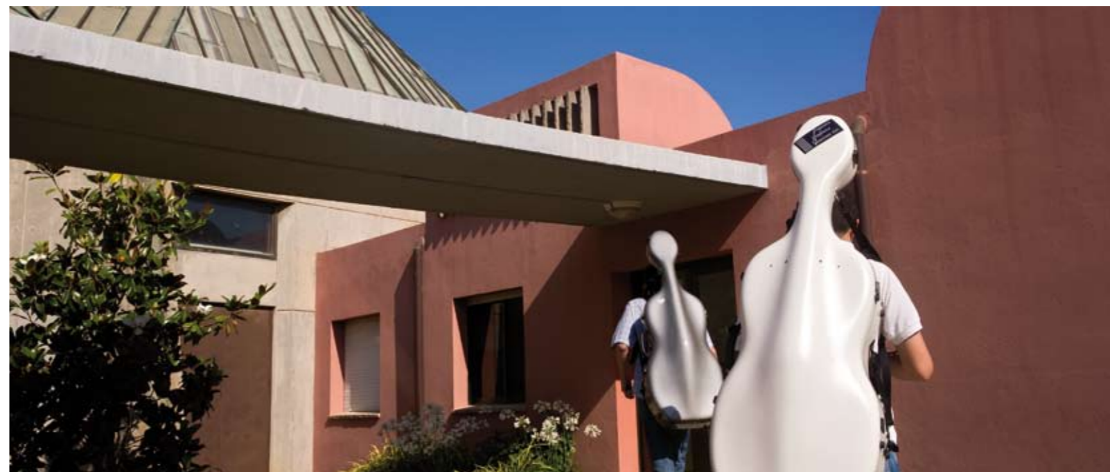
Auditori Pau Casals II , 2010 Lambda Print 72 x 30 cm