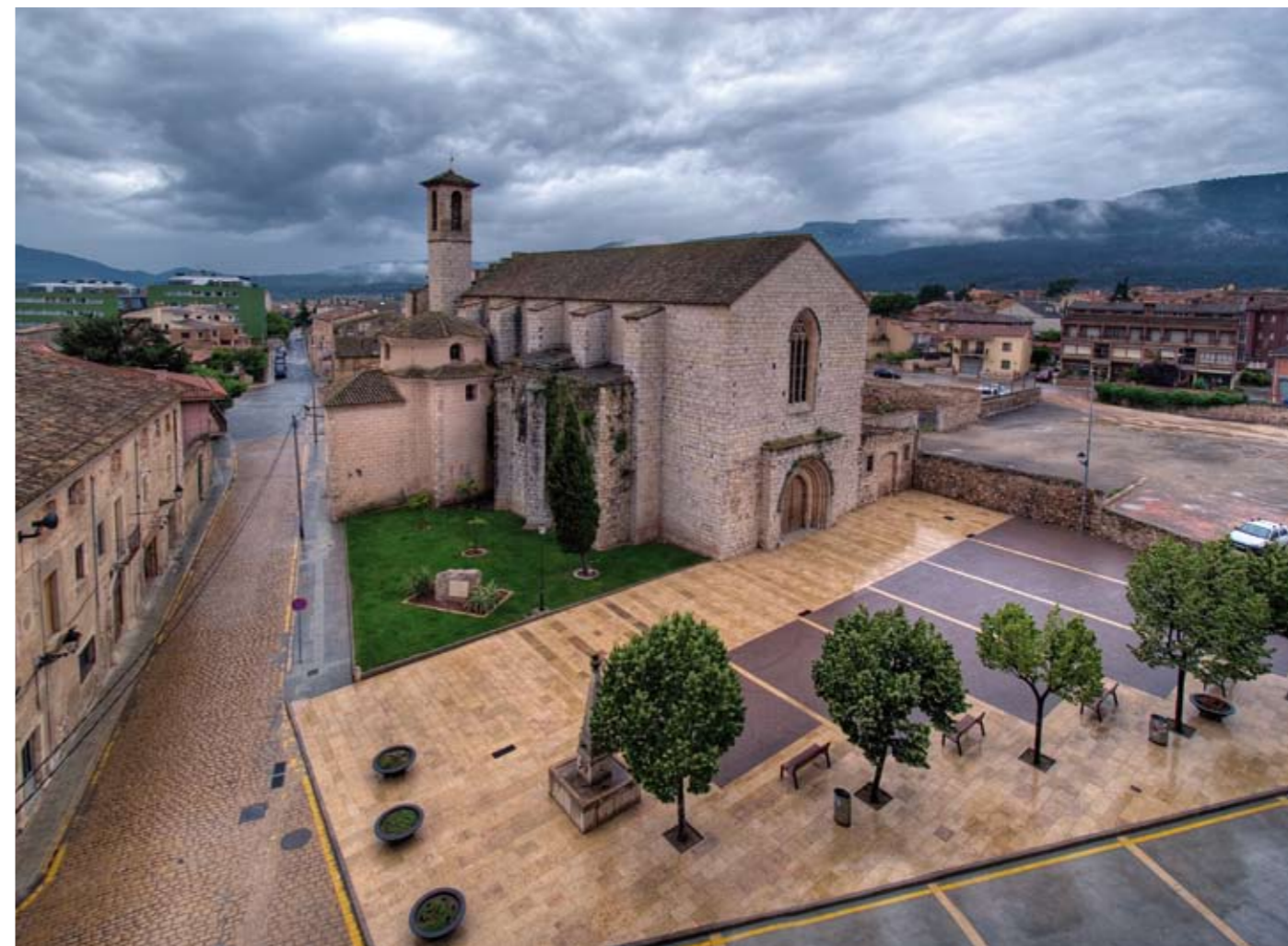
Església de Sant Francesc de Montblanc, 2010 Lambda Print sobre fusta 70 x 100 cm